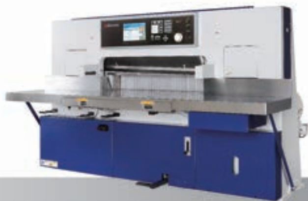
Paper Cutting Machine JMC-7s